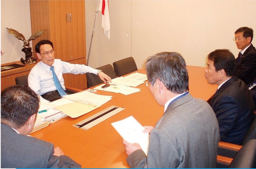
渡海紀三朗衆議院議員への要望状況